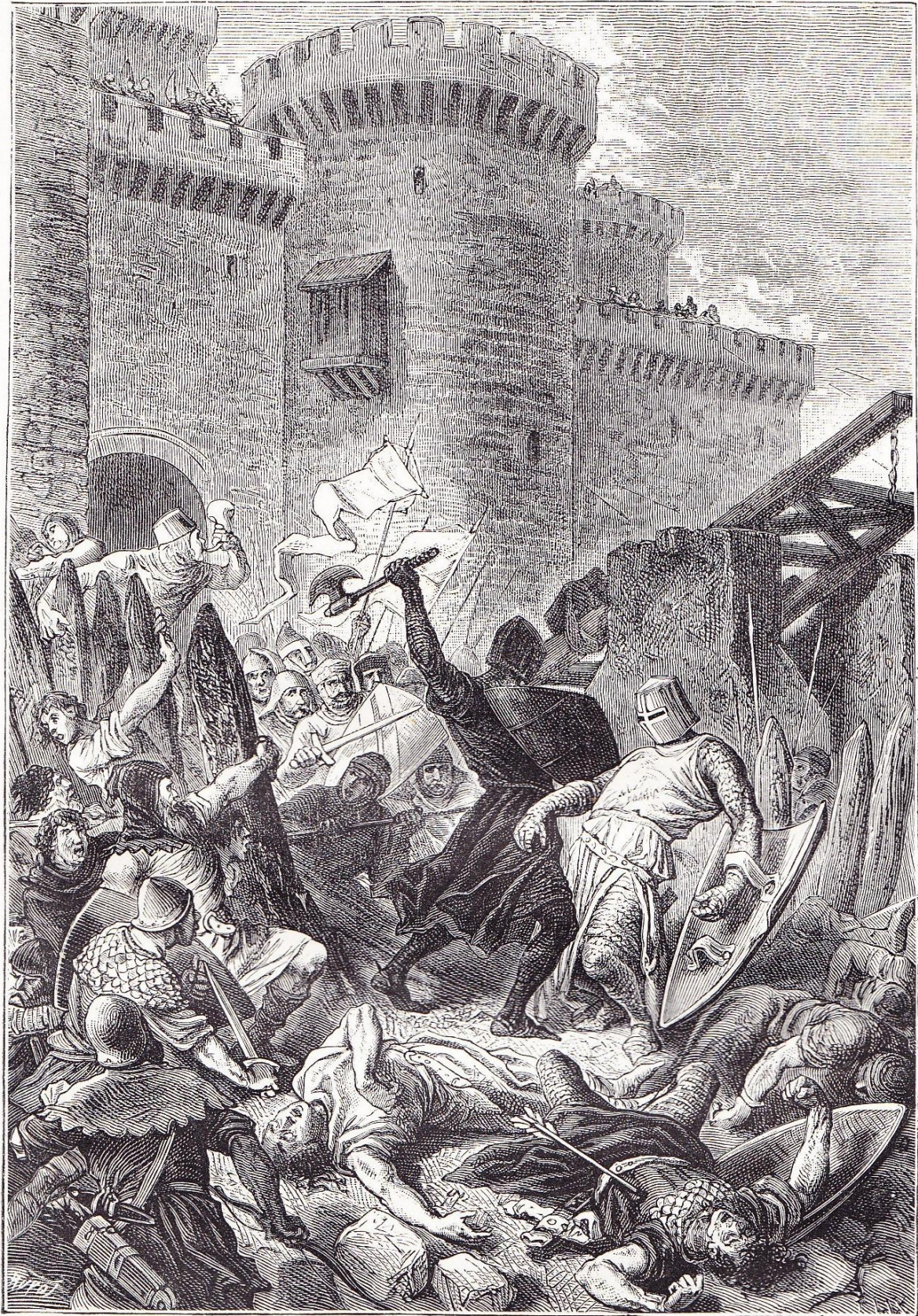
Combat du chevalier Noir et de Front de Bœuf en avant de la barbacane.